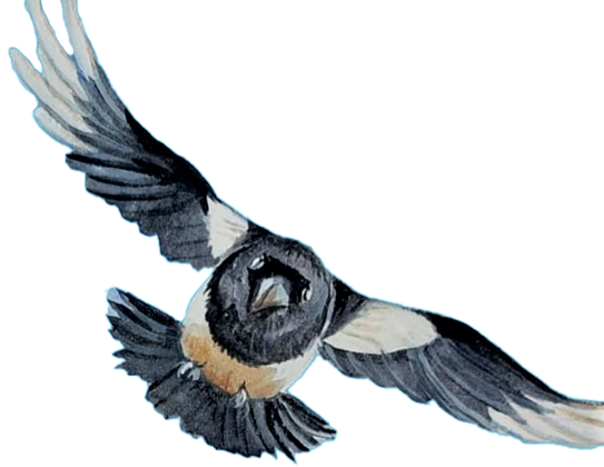
... und sein Gegenspieler, der Graurücken-Krähenwürger

gefunden haben, die sich von unserer Lust an schrägen Vögeln, schrillen Typen und einsamen Wölfen hat anstecken lassen. Herausgekommen sind 57 wunderbare Einzelporträts, die heiter und spielerisch die Flirt-Quintessenz des abgebildeten Tieres visualisieren.