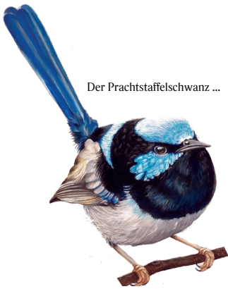
Der Prachtstaffelschwanz ...